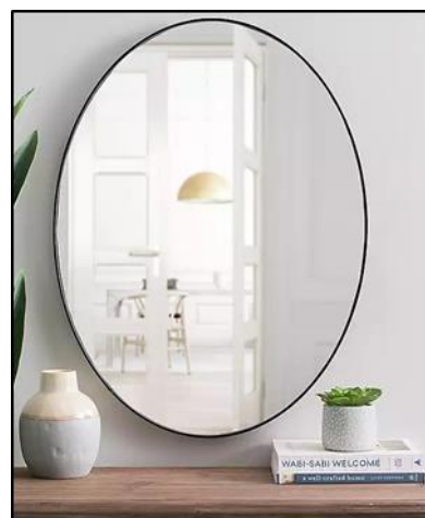
A MIRROR = ZRCADLO