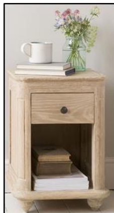
A BEDSIDE TABLE = NOČNÍ STOLEK