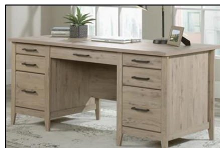
A DESK = STŮL (PRACOVNÍ)