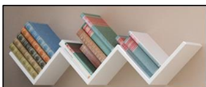
A BOOKSHELF = POLIČKA NA KNIHY