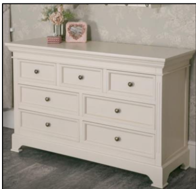
A CHEST OF DRAWERS = KOMODA

Prohlédni si následující obrázky nábytku. Názvy nábytku se nauč. Nahrávka s jejich výslovností bude poslána na e-mail.