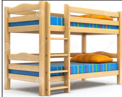
A BUNK BED = DVOUPATROVÁ POSTEL