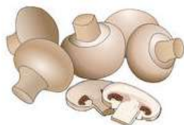
MUSHROOMS = HOUBY

*** Nahrávka s výslovností bude poslána na e-mail.