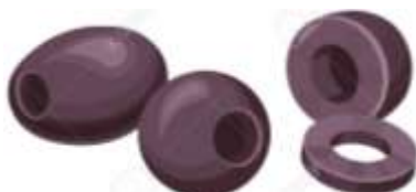
OLIVES = OLIVY