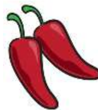
PEPPERS = PAPRIKY

Prohlédni si obrázky pizz a do školního sešitu napiš, které ze tří ingrediencí (mushrooms, olives, peppers) se na nich nacházejí.