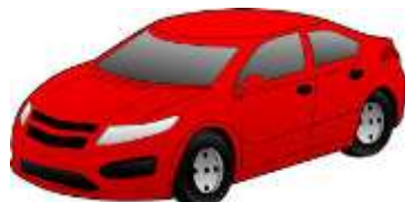
A CAR = AUTO

Prohlédni si následující obrázky hraček a nauč se je. Jejich výslovnost bude poslána emailem.