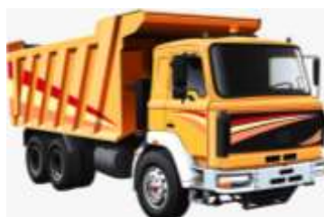
A LORRY = NÁKLADNÍ AUTO