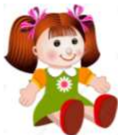
A DOLL = PANENKA