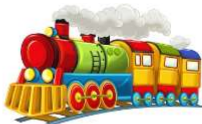
A TRAIN = VLAK