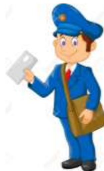
A POSTMAN = POŠTÁK