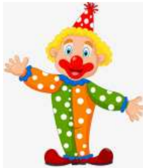
A CLOWN = KLAUN