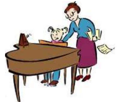
A MUSIC TEACHER = UČITEL/KA HUDBY